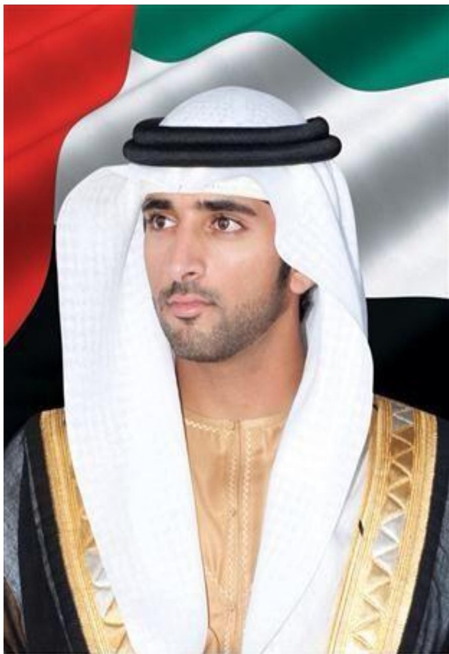
سمو الشيخ حمدان بن محمد بن راشد آل مكتوم ولي عهد دبي

H. H. Sheikh Hamdan Bin Mohammed Bin Rashid Al Maktoum Crown Prince of Dubai